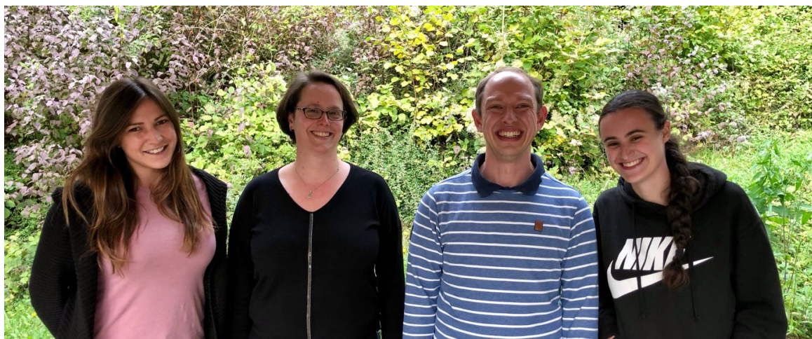
Beratungs- und Unterstützungsteam der BOS